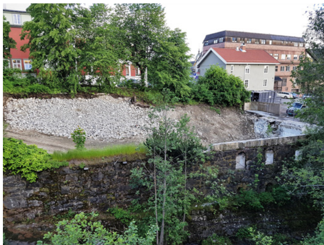
Terrassen, et symbol på en investering vi ikke bør prioritere.

Alle nødvendige investeringer må gjennomgås på nytt for å sikre en nøktern standard. Vi trenger ikke flere signalbygg.