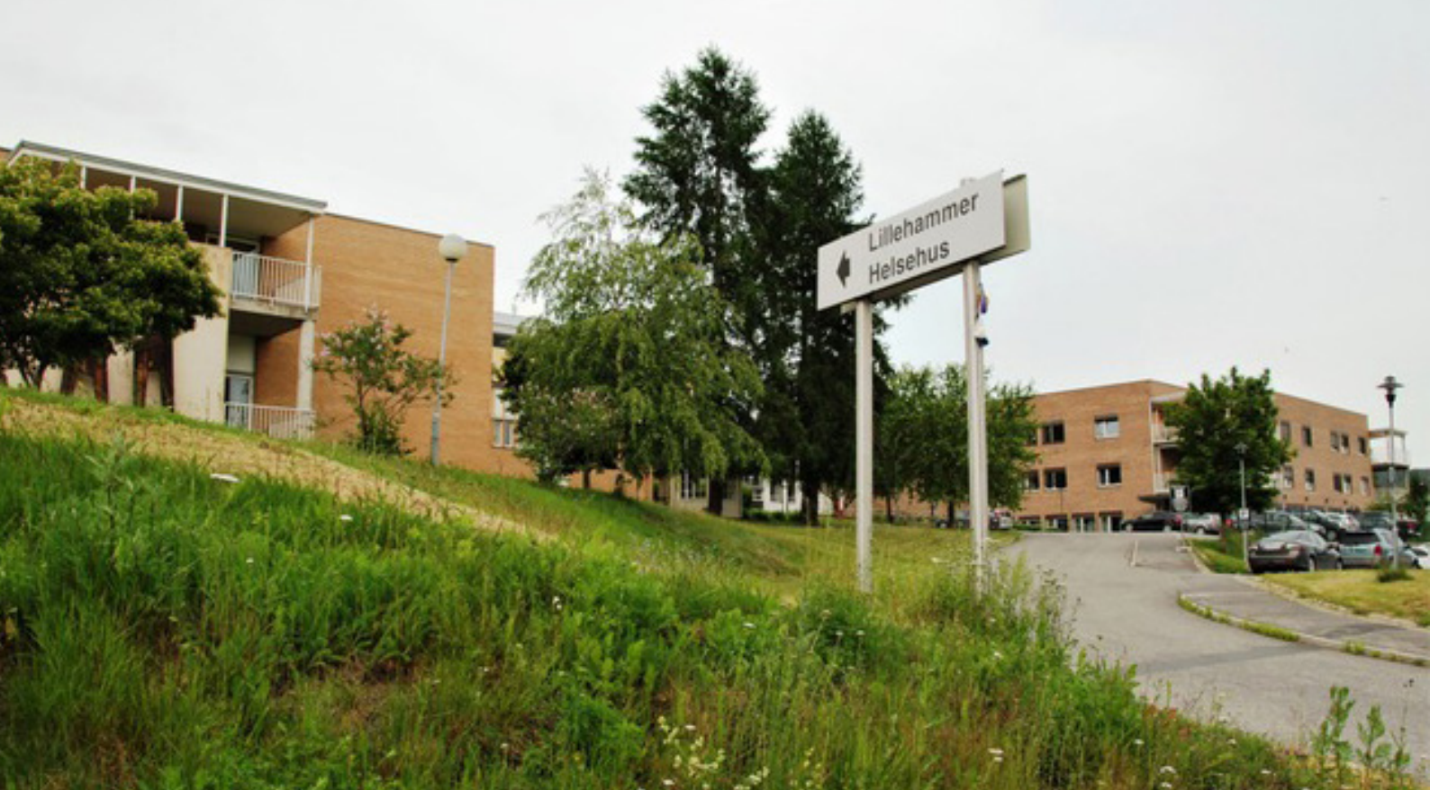
Lillehammer har ingen sykehjemsplasser å miste.